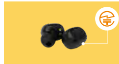
ワイヤレスイヤホン:本体やタグなど