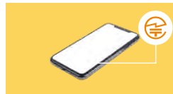
スマートフォン等では、液晶画面に表示される場合も