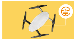
ドローン:送信機とドローン本体の裏側、側面または内蔵バッテリーを取り外した部分など

無線機器の見やすい箇所や、取扱説明書および包装または容器、ディスプレイ等に表示されています