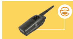
トランシーバー:裏面または内蔵バッテリーを取り外した部分